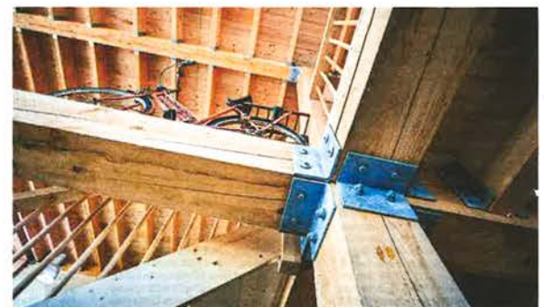
De vroegere 'postfiets' van Nooitgedagt kreeg ook een plek in het museum.