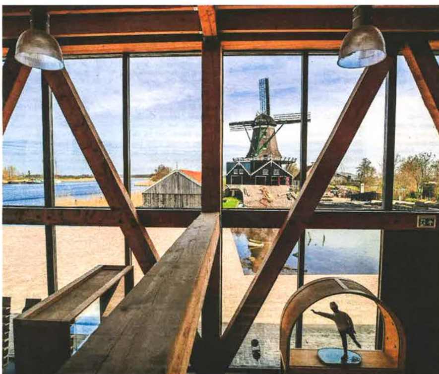
Museum Houtstad IJlst is gemaakt van veel hout en glas en biedt een prachtig uitzicht op Molen de Rat en de Geau.