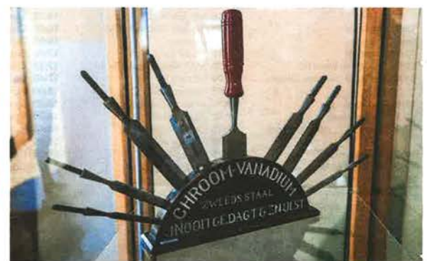
Bij Nooitgedagt werden op het hoogtepunt 1,2 miljoen beitels per jaar gemaakt.